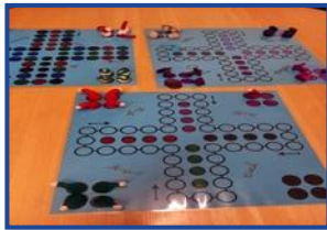
Spiele komplett selbst gebastelt